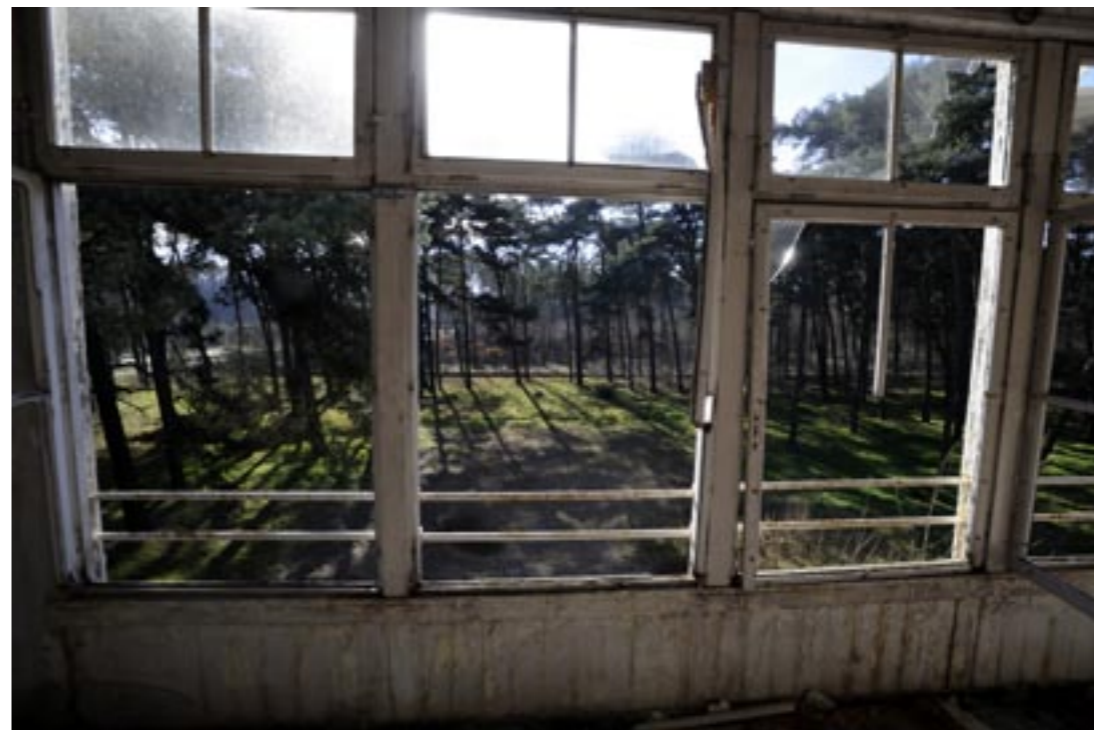
Het weeshuis in As. Urbex'ers nemen zekere risico's. Vloeren en trappen kunnen vermolmd zijn.